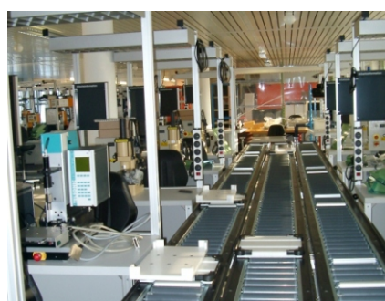
Montagetisch mit WT-Umlauf