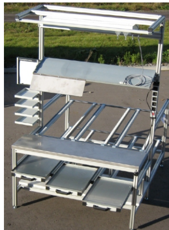
Montagetisch mit Teilelogistik